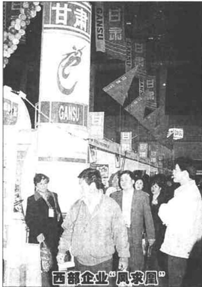
在2000年天津春季全国商品交易会上，甘肃省的企业抓住西部大开发的机遇，充分展示自己的优势，寻求合作伙伴，这是甘肃展台一角。

在回答国家将采取哪些措施增加农民收入的提问时，刘成相说，目前有关部门正从五个方面着手增加农民收入。这些措施包括调整农业结构，增加优质高效农产品的种植面积；加大农业科技投入力度；加强农业基础设施建设；切实减轻农民负担；加大扶贫攻坚力度。他同时指出，当前我国经济正处于结构调整的关键时期，在短期内大幅度提高农民收入有一定难度。